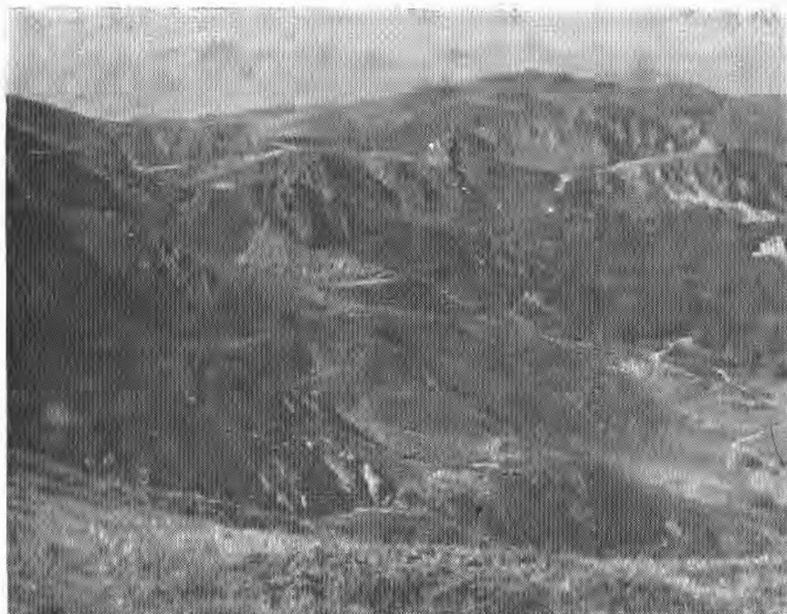
Сл. 1. — Поглед са Бјеласице

јединственог у Европи. Читав комплекс прашуме третиран је као строго заштитна зона у којој се не дозвољава било каква градња или експлоатација његових елемената, затим заштитни појас и туристичко рекреациона зона, која обухвата широки појас масива Бјеласице изван граница ужег дијела овог парка. Према томе, прашумски резерват је као основни разлог за проглашење подручја националним парком и у овом случају носилац природног активирања парка без икакве повреде његова интегритета.