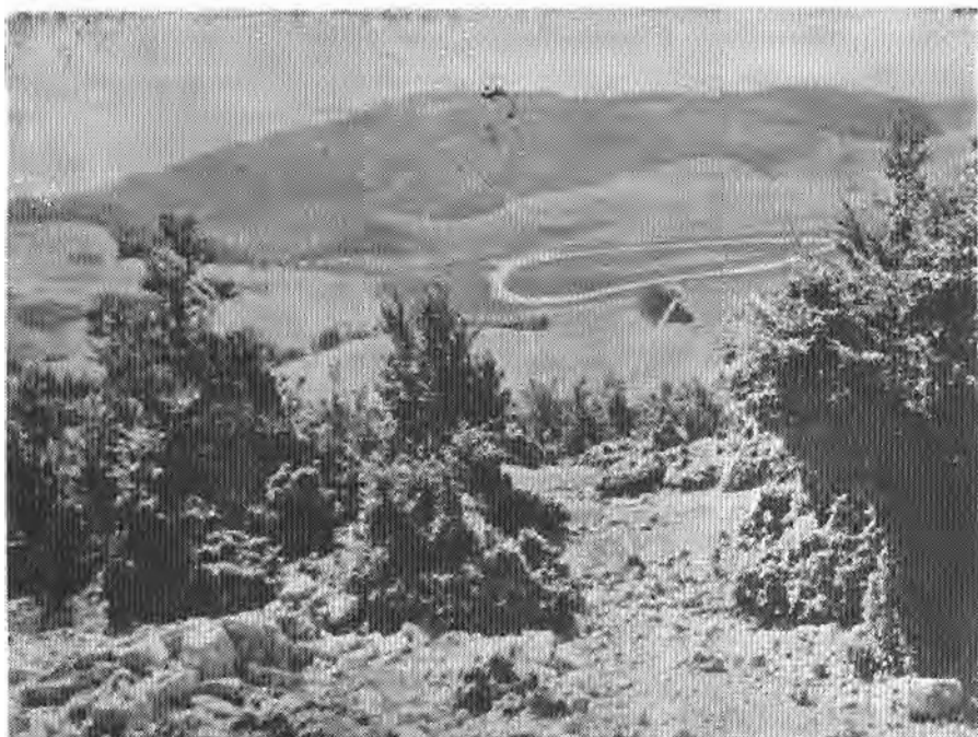
Сл. 3. — Пошћенско језеро на Дурмитору

предвиђеним границама. Укупна планирана површина износи око 33 000 хектара, са строго заштитном зоном од око 3 000 хектара, туристичко-рекреативном око 1 000 и остатком зоном толерантнијег режима. На цјелокупној територији предвиђа се издвајање мањих површина које би имале строго заштитни и научни карактер, док би остале служиле у сврхе предвиђене усвојеним програмима коришћења. За све шуме изван предвиђене строгозаштитне зоне изграђени су шумско-уређајни елаборати са рела-