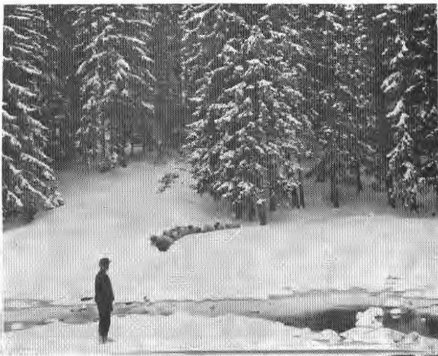
Сл. 2. — Зимски пејзаж Дурмитора

стална организација Скупштине колашинске општине, која је већ 1968. укинута и сва права и обавезе прешле су на СО Колашин. Угоститељством се у оквиру парка бави угоститељско предузеће „Бјеласица” из Колашина, које иначе доста мало доприноси унапређивању овога објекта као националног парка. Добија се утисак да би боље рјешење било, и у далеко већем интересу општег унапређења овога парка, ако би све дјелатности унутар парка биле обједињене кроз рад једне организације, у овом случају свакако одговарајуће управе националног парка.